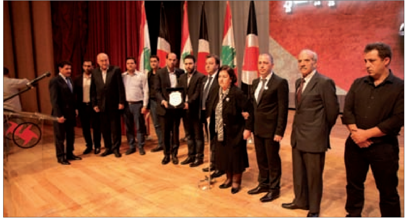
درع تذكارية من المنظمات الشبابية والطلابية