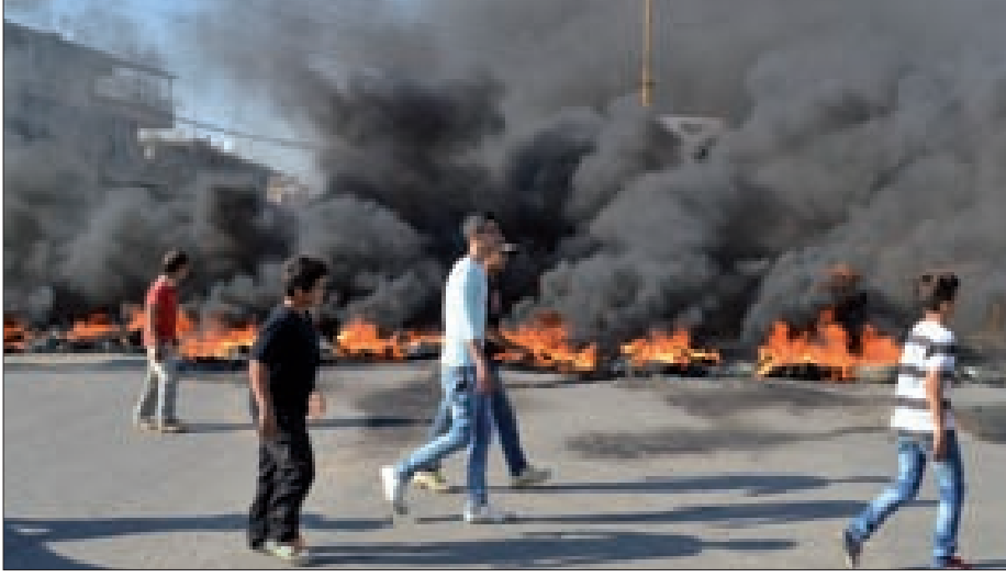
أهالي العسكريين قطعوا طريق شهر الأحمر. راشيا بالإطارات المشتعلة

عنده أن تيار المستقبل يؤيد وزير الداخلية. يبدو أنها لن تتم، بين محافظة السويداء السورية ومثل الحريري المرتبك، يبدو النائب وليد جنبلاط متوتراً، بعدما كان متحمساً لسرعة التحرك، فصار يتحدث عن انتظار التوقيت المناسب، ويشر بمصالحات كعنوان للتحرك،