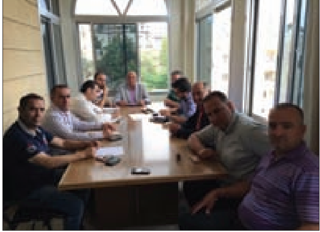
خلال الاجتماع في بلدية مجدلبعنا