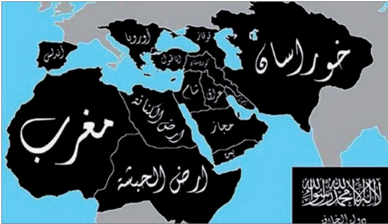
خريطة دولة «داعش»