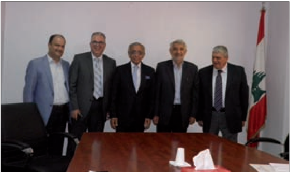
عبتاني متوسماً وفد جمعية الصناعيين

أنواعها ROROPAX و RORO وعبر خطوط النقل المختلفة التي يمكن أن تسلكها مباشرة عبر قناة السويس، وغير مباشرة عبر الموانئ المصرية». وأعلن بكداش، بدوره، أنّ الاجتماع «كان مفراً»، مثنياً للجهود التي تقوم بها المؤسسة «من أجل حل أزمة تصريف الإنتاج اللبناني في ظل إقفال الحدود البرية»، وأوضح أنّ «تطبيق هذه الآلية بإدارة خير يعود التصدير الصناعي كما كان في السابق وتعويض الخسائر التي تكبدتها الصناعة اللبنانية والتي ستعكس تراجعاً في أرقام الصادرات الصناعية».