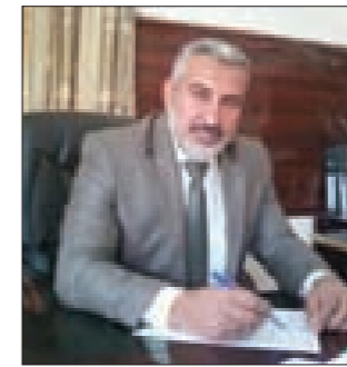
رحيم لـ«السومرية نيوز»:

وقال العبيدي الذي يزور روسيا على رأس وفد عسكري في