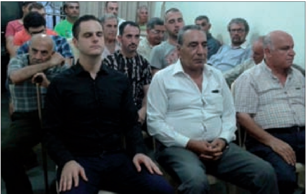
جانب من الحضور في الجديدة