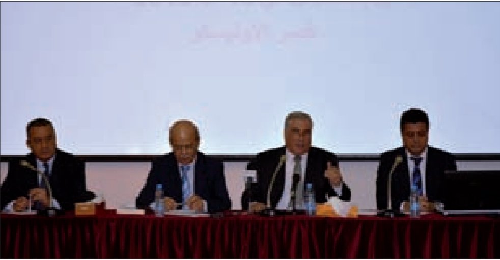
جمعة متحدثة خلال الندوة

أقامت المديرية العامة للمغتربين في قصر «الأونيسكو» ندوة بعنوان «السياسات الملائمة لإدارة الهجرة وكيفية إشراك الإغتراب اللبناني في عملية التنمية»، وتحوّرت حول الإغتراب وأسبابه وما يقدمه للبنان وكيفية إيجاد الحلول.