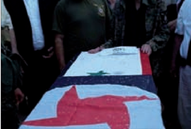
الرفيقة نوار تودع زوجها الشهيد البطل

وهذا وتتقبل عائلة الشهيد ومنفذية اللاذقية التعازي في باحة مكتب