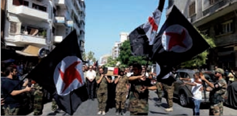
حملة أعلام الزوبعة يتقدمون موكب التشيع

الحياة ذاتها، لأننا لا نهاب الموت متى كان طريقا للحياة.