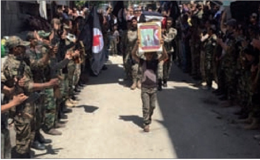
رفقاء السلاح يحيون الشهيد البطل خلال التشيع