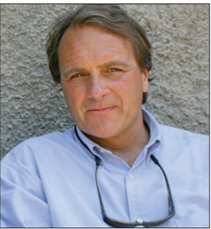
بير لـرسي أن أن:

ولفت الجبوري إلى «تحرير أكثر من 20 كم من جزيرة سامراء باتجاه منطقة اللابن غرب قضاء سامراء»، مبيناً أن «هناك انكساراً في صفوف عناصر تنظيم داعش». وأضاف الجبوري أن «عدد الأسر النازحة التي عادت إلى مدينة تكريت بلغ أكثر من 12 ألف أسرة».