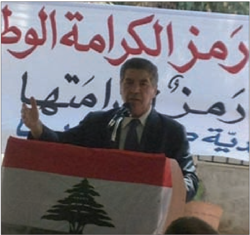
مهنا يلقي كلمته

أيضا تطلعت. فمنذ اللحظة التي عانق فيها البطل الأرض وأنا مشدود إلى بيته الحجري، إلى عريشته الخضراء، إلى تراب مزرعته الذي لمسته بعد ساعات من استشهاد طريا ندا أولا وقبل أي شيء في وعي وقناعة وإيمان متصفا وبمائه الزكية منتشبا بروح البطولة التي تجلت في عروقه الفتية وهو يمتشق سلاحه، يتصدى للغزاة، يفاجئهم، يمزق صفوفهم، يصد هجمهم غير مبال بوحده وكفرتهم، حتى إذا نفذت الذخيرة أطلوا برؤوسهم المرتجفة من وراء السياج يصرونه من دون أن ينالوا من وقته التاريخية الأصيلة التي شقت الطريق نحو مقاومة عنيدة شارك في تأسيسها وبناء مداميها الأولى مناضلون ووطنيون من كل التيارات القومية والعروبية واليسارية والإسلامية».