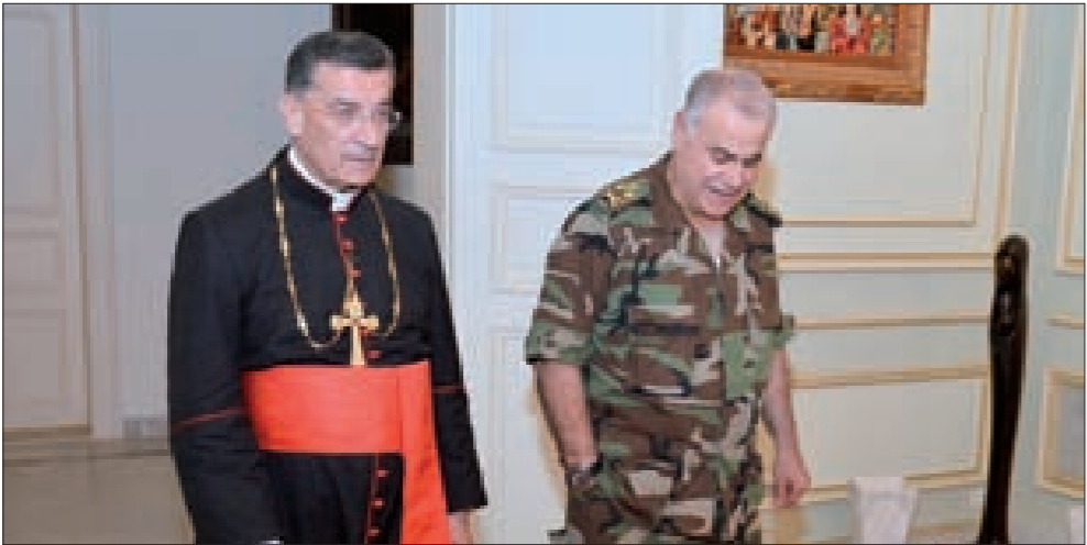
الراعي مستقبلاً قهوجي في الصرح البطريركي

بحث قائد الجيش العماد جان قهوجي مع نائب رئيس الحكومة وزير الدفاع سمير مقبل الأوضاع الأمنية، وأطلعه على ما تقوم به وحدات الجيش من تصدي في جردو عرسال وجردو بعلبك، إضافة إلى المدهامات والاعتقالات التي طالت خلايا إرهابية في عدد من المناطق. كما وضع قهوجي وزير الدفاع في أجواء التدابير الاحترازية المتخذة في العاصمة وخارجها لمؤازرة قوى الأمن الداخلي في حماية التظاهرات والمتظاهرين والتدخل إذا دعت الحاجة لمؤازرة قوى الأمن الداخلي في حال خروج هذه التظاهرات عن مسارها السلمي. كما زار قهوجي البطريرك الماروني مار بشارة بطرس الراعي وأطلعه على «موقف الجيش من مجريات