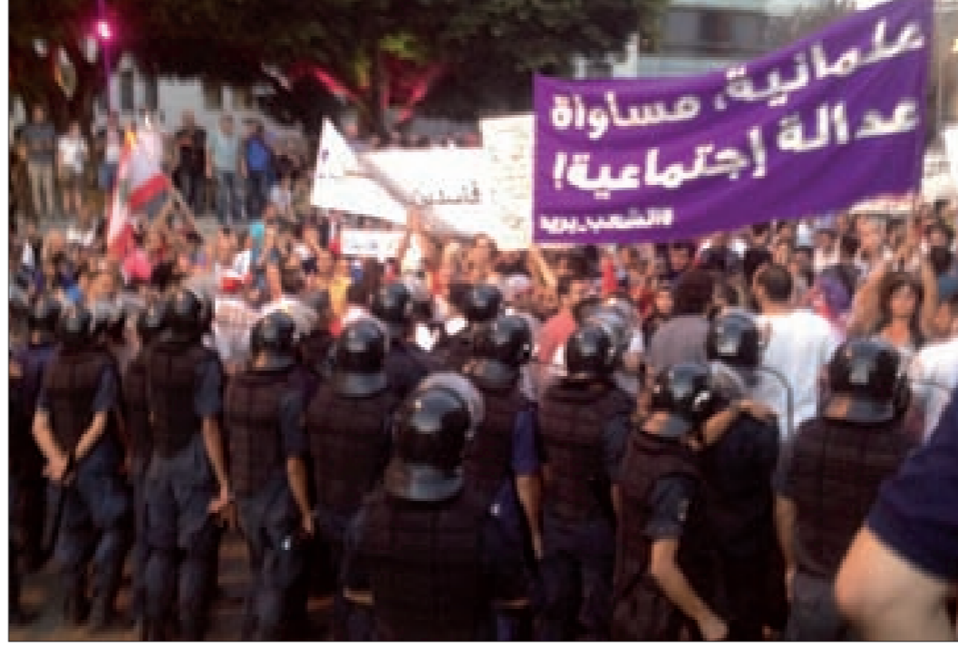
المظاهرون في وسط بيروت خلال محاولتهم اختراق الحاجز الأمني