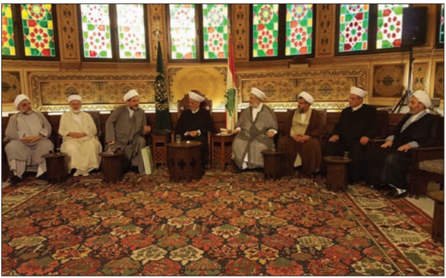
دريان مستقبلا وفد تجمع العلماء

زار وفد من تجمع العلماء المسلمين مفتي الجمهورية الشيخ عبد اللطيف دريان وعقب اللقاء، أوضح رئيس الهيئة الإدارية في التجمع الشيخ الدكتور حسان عبدالله أنّ الزيارة «في إطار التواصل المستمر مع هذه الدار التي هي دار كل المسلمين بل كل اللبنانيين، ومفتي الجمهورية هو رئيس العلماء المسلمين في لبنان، وتم البحث في شؤون الأمة الإسلامية في شكل عام ولبنان في شكل خاص، خصوصا ما يتعلق برجال الدين ومهماتهم، وكان اللقاء مخرأ». وأكد عبدالله، بحسب المكتب الاعلامي للتجمع «إنّ ما يحصل اليوم في فلسطين من محاولات لتقسيم المسجد الأقصى بداية زمانيا ثم مكانيا مقدمة للاستلاء الكامل عليه لىصار إلى دمه وبناء الهيكل المزعوم مكانه سيشكل طعنة في صميم عزّة المسلمين والعرب ما يفرض على المسلمين وعلى رأسهم العلماء المبادرة لشحذ الهمم والدعوة للمقاومة بكل أشكالها ليس لمنع تهويد الأقصى والقدس الشريف فحسب بل لتحرير فلسطين كل فلسطين»، مشيرا إلى أنّ ما كان ليحصل اليوم في فلسطين لو كانت أمتنا موحدة وعلى قلب واحد ولا تستمع لدعاة الفتنة والدعوات الضالّة للجماعات التكفيرية وأفكارهم الهامدة، لذا فإننا نتفق أنّ الخطر التكفيري يتكامل مع الخطر الصهيوني ليشلا معا العدو الأخطر لأمتنا وهذا ما يفرض ترك الاقتتال والمبادرة إلى القضاء على الحالة التكفيرية والتي يجب أن تسير على مساران الأول المواجهة الفكرية وفضح هذه الجماعات بانها لا علاقة لها بالإسلام ومفاهيمه وقائيا بالمواجهة العسكرية للقضاء على من بقي على تعصبه وضلاله ويستمر مع هذه الجماعات».