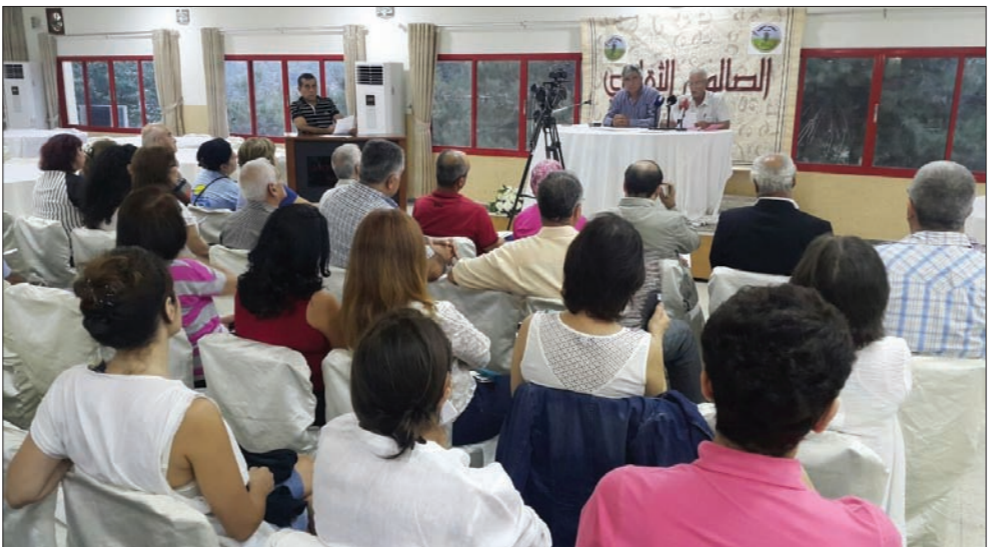
اجتماع فاعليات عكارية

ودعا كل من يفكر في هذا الموضوع «أن يترتب كي لا يواجه غضب شعبي، كما في مناطق أخرى»، مؤكداً «الحلول العلمية والبيئية والصحية والاقتصادية لحل أزمة النفايات»، كذلك، رفض «مجلس البيئة في عكار» و«اللقاء الثقافي في القبيات» خلال مؤتمر صحافي حضرته فاعليات اللبنانية – اجتماعية وطنية وممثو المجتمع المدني، «ميدا» استخدام النفايات الى عكار من خارجها»، وركزا على «معالجة النفايات العكارية وهي مشكلة كبيرة بحد ذاتها»، كما رفضا «تخصيص سهل عكار والمنطقة الشرقية عليه بوحدة من اكثر الصناعات تلوينا»، وأسفا «الايقف نواب عكار ويغضب رؤساء البلديات معوقات الدفاع عن كرامة وحقوق أهل عكار، وأن يبتزلق نواب عكار للتدخل في كيفية تصرف المجالس البلدية بالأموال العائدة اليها خصوصا أنّ في ذلك تجاوزاً للقوانين المرعية للإجراء»، وطالبا النواب بـ«الإنصراف إلى، كل المعتمدين على المتظاهرين، والمعتمضين منديين وعسكريين، حتى لو وصل الأمر الى استقالة وزير الداخلية نهاد المشنوق، وانتخابات نيابية تسجم بالتمثيل الديموقراطي لكل اللبنانيين».