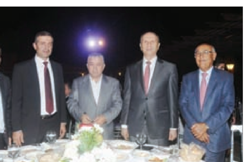
من احتفال العرس الجماعي

أعلنت كتلة التحرير والتنمية «أننا أمام أزمة في إدارة الدولة والمؤسسات»، ورأت أن «من المعيب أن ننقل إلى البحث في قضايا متصلة بالأزمة السياسية ونحن نغرق في النفايات في الشوارع». وانتقدت المشككين في جدوى الحوار، مشددة على أنه المخرج والمنفذ الحقيقي للخروج إلى شاطئ الأمان.