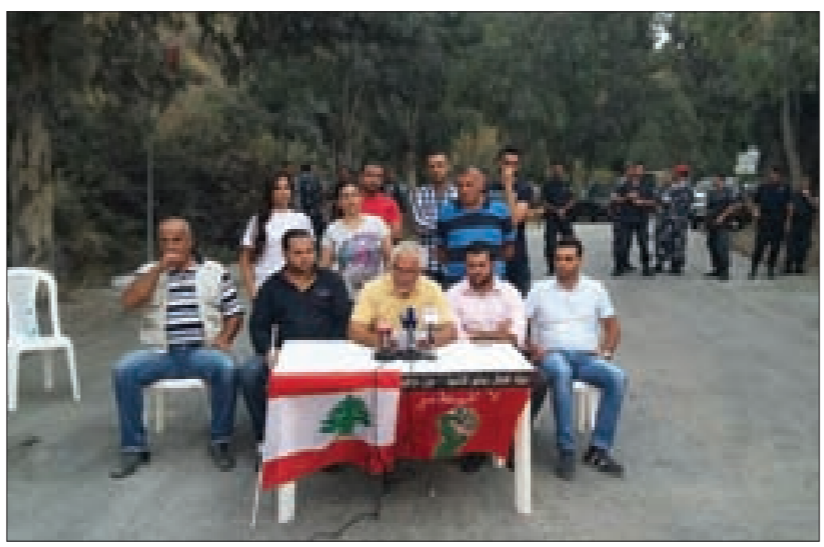
المؤتمر الصحافي «حملة إقفال مطمر الناعمة»