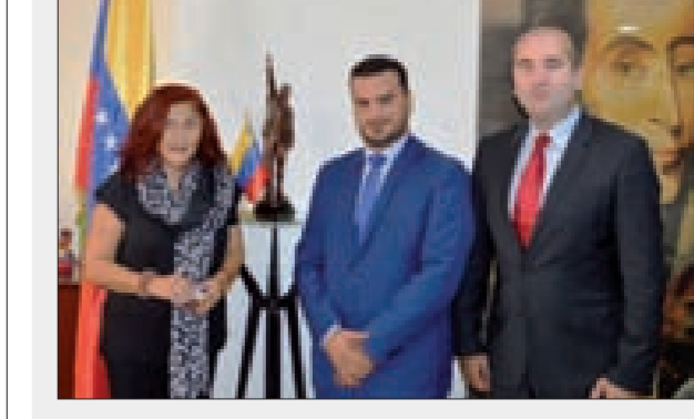
سفيرة فنزويلا وممثل حزب الاتحاد