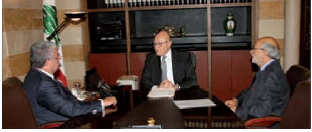
سلام مترشاً اجتماع اللجنة في السراي

ترأس رئيس الحكومة تمام سلام، صباح أمس في السراي الحكومية، اجتماعاً للجنة النفايات حضره وزيراً الداخلية والبلديات نهاد المشنوق والزراعة أكرم شهيّب ورئيس مجلس الإنماء والوزير المشنوق على ما توصلت إليه كما أعلنها الوزير المشنوق على نتائجه اجتماعاته المستمرة مع كل فاعليات عكار. وإن شاء الله يبدأ المسار الجدي الأسبوع المقبل بعدما تقدمنا كثيراً في منطقة سرار ونحن ننتظر تحديد الموقع الثاني من فاعليات المنطقة خلال الساعات المقبلة، والعمل جدي على كل السنوات والأمل أن نصل إلى مكان ما». ورداً على سؤال حول الموقع الثاني أجاب: «نحن حددنا المواقع ومنتظر موافقات مبدئية من نواح أمنيّة أو مائيّة أو غير ذلك». وحول إمكانية عقد اجتماع حكومي مخصص لخطّة النفايات، أكد شهيّب: «إنّ قرار مجلس الوزراء واضح في هذا الشأن وهو الشروع في تنفيذ الخطّة عند إنجازها، ولكن هناك بعض المراسيم التي تحتاج إليها ودولة الرئيس في الوقت المناسب سيبدو على جلسة ساعة يشاء عندما تصبح الأمور جاهزة». وعن الحراك المدني وهطول الأمطار وتأثير ذلك على النفايات، قال: «نحن نقدر الحراك المدني ولكنني لست