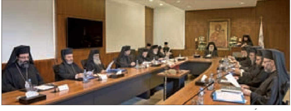
يازجي مترشاً المجمع الأنطاكي في البلنند