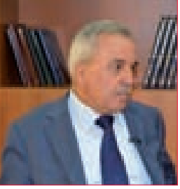
سكزية: المعركة محسومة لمصلحة سورية والعراق في محور مواجهة الإرهاب