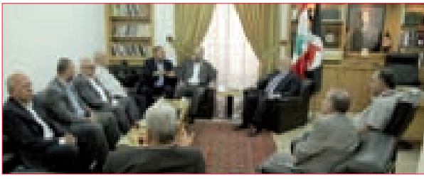
3 حردان: جيل الانتفاضة الثالثة يحول مسار الصراع لمصلحة قضيتنا