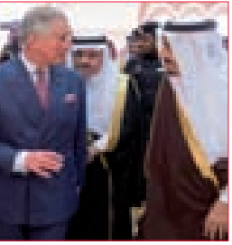
توتر مستمر ومتصاعد في العلاقات البريطانية المضطربة مع السعودية