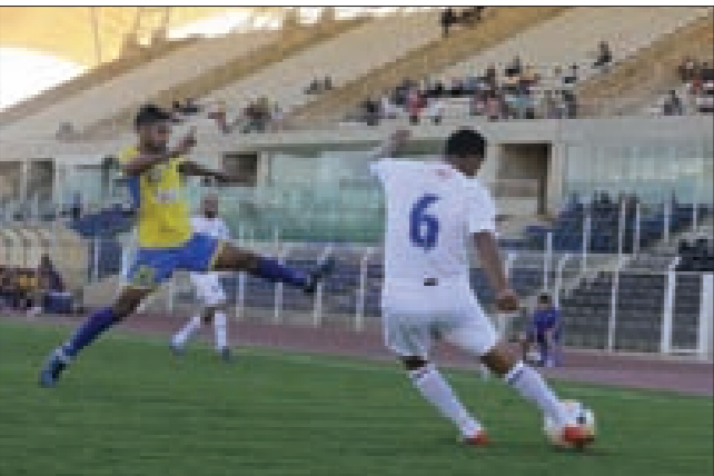
من مواجهة الراسينغ والصفاء في الموسم الماضي