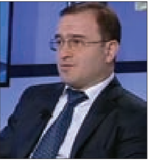
أكد الوزير المفوض في السفارة الروسية بدمشق أيلبروس كوتراشوف أن العملية العسكرية لروسيا في سورية مؤقتة وليس هناك أي سقف زمني معين لها حتى الآن، وهدفاً ضرب التنظيمات الإرهابية وإزالة تهديدها وتهينة الظروف المناسبة لبدء العملية السياسية، معتبراً أن الجانب الأميركي يعاني من مشكلة ترتيب الأولويات في سورية. ورأى كوتراشوف أن التدخل المباشر لروسيا لمحاربة الإرهاب في سورية غير التوازن الاستراتيجي في المنطقة وخفف من الحملة العدائية ضد روسيا في وسائل الإعلام بعدما بدأت الحقيقة تصل إلى الدول الغربية. وقال: «إن التدخل العسكري في بلد ما يجوز في الحالتين: إما يطلب من هذا البلد وأما بتفويض من مجلس الأمن، مشيراً إلى أن الحكومة الشرعية تقدمت بطلب لمساعدتها بقوات من سلاح الجو الروسي ووافقنا على ذلك». ولفت كوتراشوف إلى أن علاقات الصداقة بين سورية وروسيا تمتد لعقود طويلة وليست وليدة اللحظة وتتسجم مع مبادئ القانون الدولي، معتبراً أنه من حق روسيا إقامة علاقات ثنائية مع سورية في المجال الذي تراه مناسباً، لافتاً إلى أن بلاده متفقة مع الدول الغربية على أن سورية يجب أن تبقى دولة موحدة ذات سيادة. وجدد الوزير المفوض في السفارة الروسية في دمشق تأكيد موقف بلاده الداعي إلى حل الأزمة السورية بالطرق الدبلوماسية عبر حل سياسي بالتوازي مع مكافحة الإرهاب، مبيناً أن روسيا لا تقوم بخطوات أحادية الجانب في سورية ولكنها تود الانطلاق من مواقف مشتركة مع الآخرين وهي تريد من كل الدول تحمل مسؤولياتها في محاربة الإرهاب. وشدد كوتراشوف على أن لا يمكن البدء بعملية سياسية لحل الأزمة في سورية مع بقاء الإرهاب وقال: «إن روسيا أعلنت استعدادها منذ البداية لمساعدة السوريين في حل الأزمة ودعت المجتمع الدولي إلى توحيد جهوده السياسية وحتى العسكرية للمحافظة على سورية كدولة ومجتمع والتكثيف من الدول شاركت روسيا في وجهة النظر هذه».