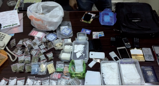
مخدرات ضبطت في الزعيترية