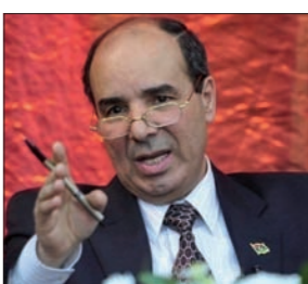
صرّح سفير ليبيا لدى الأمم المتحدة إبراهيم الدباشي أمام مجلس الأمن أن التوصل إلى اتفاق على تشكيل حكومة وحدة في ليبيا وشيك، ويمكن أن يتم خلال هذا الشهر.

وقال إبراهيم الدباشي أمام أعضاء المجلس الـ15 إن تشكيل حكومة وحدة بليبيا وشيك، وقد يتم قبل نهاية الشهر الحالي. أكد سفير ليبيا لدى الأمم المتحدة أن تشكيل حكومة الوفاق الوطني بات وشيكاً، وشدد في هذا السياق أن مجلس الأمن لم يتخذ خطوات جديدة لتوفير البيئة الآمنة، لتتطوّر أعمال الحكومة من مؤسساتها في العاصمة طرابلس. كما طالب الدباشي بتشكيل قوة خاصة محايدة من ضباط وأفراد الجيش والشرطة. وحاج هذا التصريح عادة إعلان الأمم المتحدة تعيين الدبلوماسي الألماني مارتن كويلر ممثلاً خاصاً للأمين العام للأمم المتحدة ورئيساً لبعثتها في ليبيا، خلفاً للإسباني برناردينو لوبون.