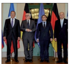
قيّم وزير الخارجية الروسي سيرغي لافروف أمس إيجابياً نتائج اللقاء الذي أجراه ونظّمه الألمان والفرنسي والأوكراني في برلين لبحث الوضع في جنوب شرق أوكرانيا. وقال لافروف

للصحافيين عقب لقاء «رباعية النورماندي» إن وزراء خارجية الدول الأربع أجروا نقاشاً مفيداً ومثمراً، وذكر أنهم أقرّوا بنجاح عملية سحب الأسلحة من عيار أقل من 100 ملم من خط التماس بين طرفي النزاع. وأشار بهذا الصدد إلى أن الوزراء الأربعة اتفقوا على تطبيق جدول سحب هذه الأسلحة أيضاً من عيارات أكبر، وطلبوا من مجموعة الاتصال بشأن أوكرانيا وضع جدول مناسب بهذا الشأن بأسرع ما يمكن. كما تطرق لافروف إلى مشكلة نزع الألغام في منطقة النزاع، مشيراً إلى أن هذه المشكلة تعقد كثيراً الحياة اليومية لاهالي دونباس.