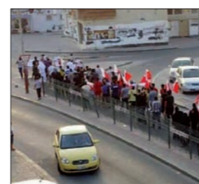
رفعت التظاهرة البحرينية الحاشدة في الدراز غرب المنامة بعد صلاة الجمعة مطلب العدالة ونيل التمييز والانتقال إلى نظام ديموقراطي يكون الشعب مصدر للسلطات فيه بعيداً عن استفراد عائلة ببادارة الحكم والتحكم في ثروة البلاد.

رفع المشاركون في التظاهرة صور أمين عام الوفاق الشيخ علي سلمان وهنّافات ترفض اعتقاله مع باقي الرموز السياسية والدينية، كما ردوا هنّافات ضد المداهمات التي تشهدها البلاد خلال اليومين الماضيين والتي خلفت عشرات الاعتقالات ودماراً أكثر من 70 منزلاً في مختلف مناطق البلاد. وكان خطيب الجمعة اعتبر أنّ مجرد التدوين لحق التعبير عن الرأي في الدستور غير كافٍ للانتفاع من هذا الحق ما لم يكن ذلك مشفوعاً بضمانات تشريعية وعملية، وقال، أنّ صاحب الرأي يخشى على نفسه من الملاحقة والمساءلة والإدانة.