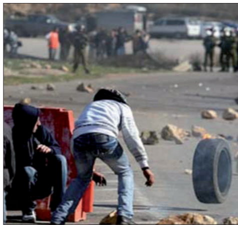
البيرة إصابة شاب فلسطيني بصورة حرجة خلال المواجهات المتعددة بين شبان فلسطينيين وقوات العدو. وعلى حاجز حزما شرق القدس المحتلة أصيب مستوطن بجروح طفيفة، جراء إلقاء زجاجات حارقة على سيارته، وعلى الفور انتشرت قوات العدو بكثافة على الحاجز.