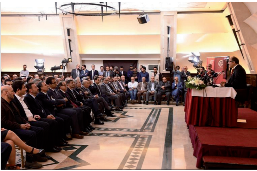
بن جندو متحدثاً أمام الحضور الحاشد في المؤتمر الصحافي

«الإخوان المسلمين» في ليبيا، كان التشاور الروسي المستمر في كل الاتجاهات، حيث اتصل الرئيس الروسي فلاديمير بوتين بالرئيس المصري عبد الفتاح السيسي، موضحاً قرار الوقف الموقت للسفر إلى شرم الشيخ في ضوء الحملة الغربية و بانتظار انتهاء التحقيق، مؤكداً العلاقة الخاصة والمميزة بين البلدين والحكومتين، بينما تواصل وزير الخارجية الروسي سيرغي لافروف مع وزير الخارجية الأميركي جون كيري في متابعة لما تم الاتفاق عليه مع المبعوث الأممي ستيفان دياردين، وضرورة تحمل الأمم المتحدة مسؤوليتها القانونية في حسم ملف القوى والشخصيات التي تحسب تحت عنوان المعارضة بين الإرهاب الواجب إعلان الحرب عليه والمعارضة الواجب دعوتها إلى المشاركة في العملية السياسية، وفقاً لنص مبادئ فيينا؛ وهو الشيء نفسه، كما قالت مصادر إعلامية روسية، الذي يحثه لافروف مع وزير الخارجية التركي، وكل ذلك على إيقاع الانتصارات التي يحققها الجيش السوري وحلفاؤه والمتنقل بين الجبهات المحيطة بمدينة حلب، من ريف اللاذقية إلى ريفي إدلب وحماة، ووصولاً إلى الريف الحلبى شرقاً وغرباً وجنوباً وشمالاً. في لبنان يتواصل الترنح السياسي تحت ضربات الفشل في حل أزمة النفايات، مضافاً إليه التعقيد الذي يعطل التفاهم على حل (التتمتع ص6)