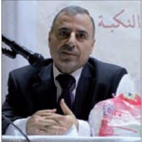
الحسنية متحدتاً في الدور

معتبراً أن الطائفية والمذهبية والعشائرية والانظمة المرتبطة مع الخارج، تشكل عوامل مساعدة لأعدائنا. وشهد الحسنية على أن ما يحصل في الشام ليس منفصلاً عن المخطط الذي يستهدف فلسطين وكل الأمة، بل هو مترابط، فاستهداف سورية بالارهاب لاسقاطها، هو لانها دولة مقاومة وهي على الدوام قلب المحور المقاوم، وهي اليوم تقاتل من خلال جيشها وفصائل المقاومة ضد المشروع التقني الاستعماري الإرهابي.