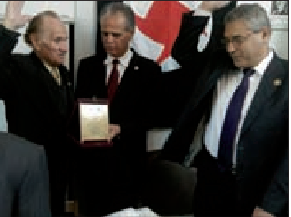
البحري يقدم درعاً تقديرياً للأمين للغوثاني