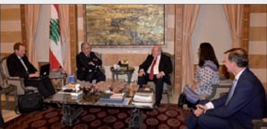
المشنوق وفد مجلس العموم البريطاني

◆ ترأس مفتي الجمهورية الشيخ عبد المحطيف دريان اجتماعاً لمجلس القضاء