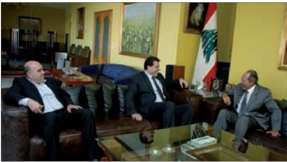
لحود مستقبلاً يعقوب

استقبل الرئيس العماد إميل لحود في دارته في البرزة، النائب السابق حسن يعقوب الذي قال: «الذي دفعنا ثمنه بالدماء والشهداء ليس من الممكن أن نخسره بالسياسة والتفاوض، ويبدو أن هناك محاولة للاتفاق حول المنجزات التي سئاني حكماً في المرحلة المقبلة، ونحن نتمنى حل الأمور وأن تحصل الانتخابات الرئاسية في أسرع وقت ونبدأ بالسير بالأمور بطريقة صحيحة، ولكن لا يوجد أي شيء حتى الآن، بانتظار نتيجة المفاوضات فيينا