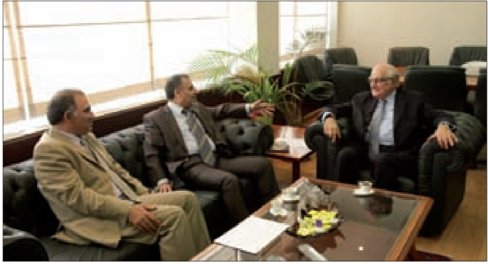
جريج مجتمعاً إلى الحسنية وحمية

بالإجراءات اللازمة لعدم تكرار المسئ برمزية الشهيدة سناء محيدلي، وأن تقدم المحطة اعتذاراً واضحاً وغير ملتبس عن الخطيئة التي اقترفتها». بدوره أكد محفوظ أنه «سيجري الاتصالات اللازمة بمؤسس المحطة غريبال المر والأستاذ ميشال المر لاستيضاح الأمر، علماً أن مقاربة المجلس الوطني هي التمييز بين الانتحاريات التابعات للتطبيقات