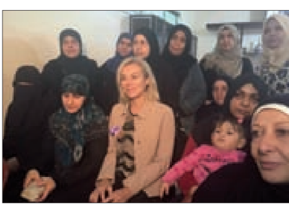
كاغ تتوسط لاجئات

أطلقت الأمم المتحدة حملة 16 وهي جزء من حملة عالمية تهدف إلى تعزيز العمل «للحد من العنف ضد المرأة والفتيات وتمكينهن». وخلال زيارة مركز نسائي في مخيم للاجئين الفلسطينيين في برج البراجنة ولاحقا مركز في الشوفيات، شددت المنسقة الخاصة للأمم المتحدة في لبنان سيرغيد كاغ على «أهمية تمكين المرأة والفتيات من خلال التعليم، كواحدة من المسارات لضمان حماية أكبر من العنف».