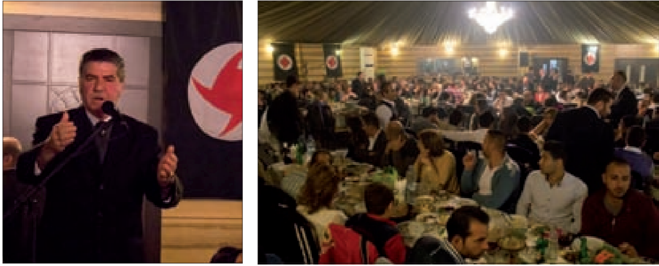
جانب من الحضور الحاشد في حفل العشاء