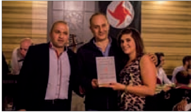
الخراط تتسلم الدرع من المنفذ العام وناظر الإذاعة