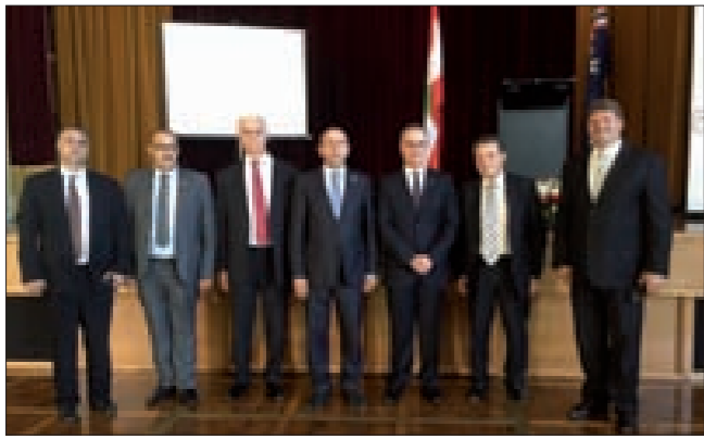
القائم بالأعمال اللبناني في كامبرا

من ناحيته تطرّق السفير سوروزوف للمستجدات العالمية وأهمية موقفه بلاده في حسم الخيارات باتجاه الفعل الميداني لاستئصال الإرهاب، مؤكداً أهمية صمود الدولة السورية وتأييد بلاده لسوريا، ورئيسها المنتخب من الشعب الدكتور بشار الأسد، لافتاً إلى أنّ الرئيس الأسد ضمان لوحدة سورية، والكلمة في بقائه رئيساً هي للسوريين أنفسهم، وأنّ القوى الدولية التي ترى غير ذلك، تريد لسوريا مصيراً شبيهاً بليبيا.