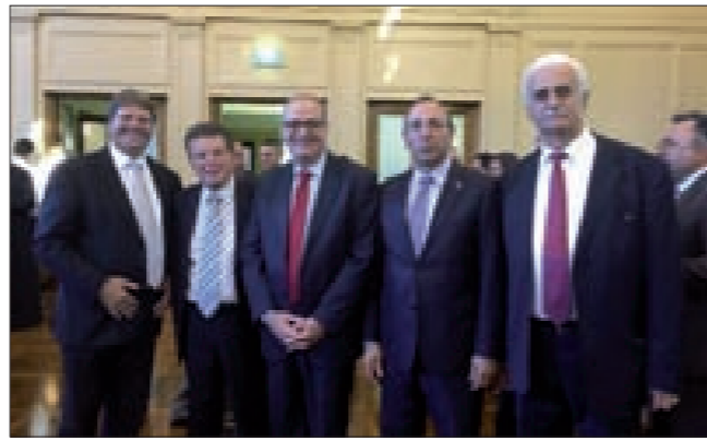
ومع السفير الفلسطيني