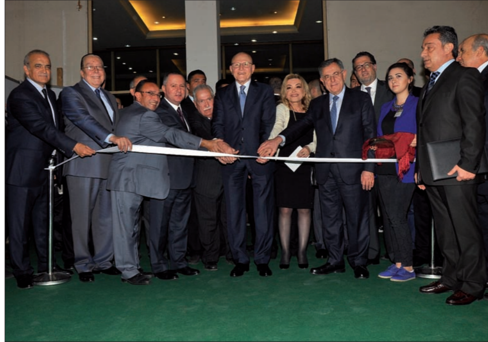
سلام مفتتحاً معرض الكتاب أمس