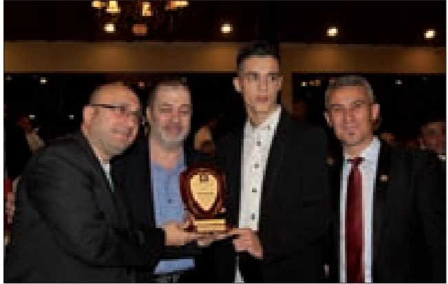
كردية يتسلم الدرع