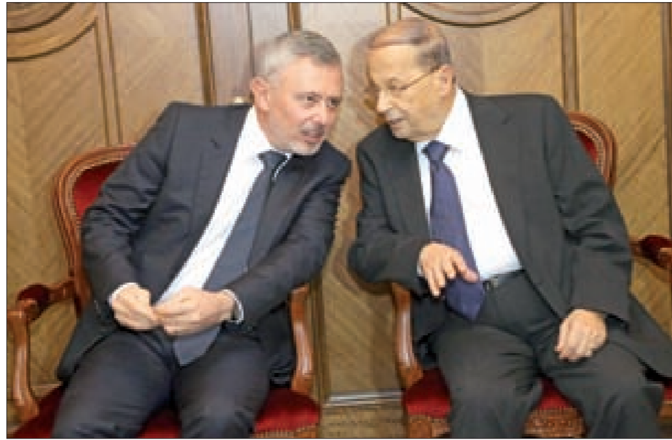
عون وفرنجية خلال ل التعازي في كنيسة القيامة

باريس - نضال حمادة بعيداً عن بازار التصريحات والإطلاقات الإعلامية للجنود الأسرى السابقين، وردود الفعل الشعبية المنتقدة أو المؤيدة لما تضمنته كلام بعض عناصر الشرطة الذين خرجوا من سجون جبية «النصرة» في متاهات جبال القلمون وأوديتها، أتت عملية التبادل في الشكل، والتي تحمل في الجوهر تسوية أولية تمهّد لإنسحاب جبية «النصرة» تدريجياً من جبال القلمون، مع اقتراب نزوح الظروف المحلية المحيطة بالقلمون السوري في حي الوعر بحمص، حيث بدأت معالم تسوية تتصنّف انسحاب المسلحين من داخله بالطريقة نفسها التي تَبَّ بها انسحاب المسلحين من أحياء حمص القديمة، ما يفقد مسلحي القلمون أي أمل بالتواصل مع حمص وريفها، فضلاً عن اقتراب الحل النهائي في الزيداني مع التطورات العسكرية في ريف حلب الجنوبي القريب من الفوعة، حيث يتقدّم الجيش السوري بشكل بطيء نسبياً ولكن بثبات، ومع التقدم الذي يُحرزه الجيش في ريف دمشق خصوصاً. كلها عوامل زادت في عزلة مسلحي جبية «النصرة» (التتمة ص13)