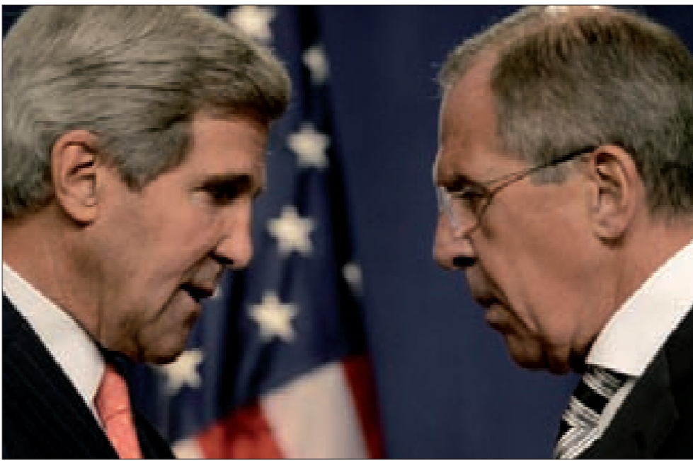
لا فروف يلتقي كيري درساً في أصول الدبلوماسية

أن تصنيف المنظمات الإرهابية التي تستهدفها الحرب قد طال كثيراً، ولا مبرر للانتظار أكثر، وأي اجتماع مقبل في نيويورك وغيرها يجب أن يحسم هذا الأمر. وثالثاً تصرّ موسكو على عدم التفرد بتحديد مكان الاجتماع من دون موافقة المشاركين. وفي شأن نيويورك يجب الوقوف على رأي إيران ورؤية رغبتها وقدرتها على قبول المشاركة في لقاء يُعقد في نيويورك. ولم ينسَ لا فروف أن يملح الرد بكلامه عن ادعاءات كيري بأن كلامه عن دور الرئيس السوري في المرحلة الانتقالية يستند إلى ثقته بموافقة روسيا على تتخيه بعد نهاية هذه المرحلة، ليكون كلام لا فروف من عيار أقله اتهام كيري بالكذب وعدم اللياقة وتزوير كلام الرئيس الروسي يُعتبر عيباً على وزير خارجية دولة عظمى وخطأ دبلوماسياً جسيماً.