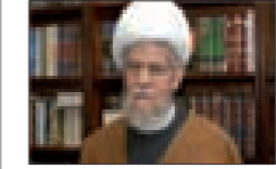
العلامة الشيخ عفيف النابلسي

لم يكن مطلب انتخاب رئيس للجمهورية هيئاً في يوم من الأيام، فكيف في هذه الظروف التي تشتعل فيها النيران في جهات المنطقة كلها؟