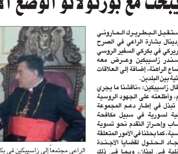
الراعي مجتمعاً إلى زاسيبكين في بكركي

في مبدأ الانتظار». وكان بطيريك الماروني التقى أيضاً رئيس الرابطة المارونية في بلجيكا ورئيس المجلس الاتحادي مارون كرم. كما استقبل قائد قوات الطوارئ الدولية العاملة في لبنان الجنرال لوتشيانو بورتولانو الذي أطلعته على الوضع العائلي في منطقة الجنوب. وأكد بورتولانو أنّ الوضع الحالي