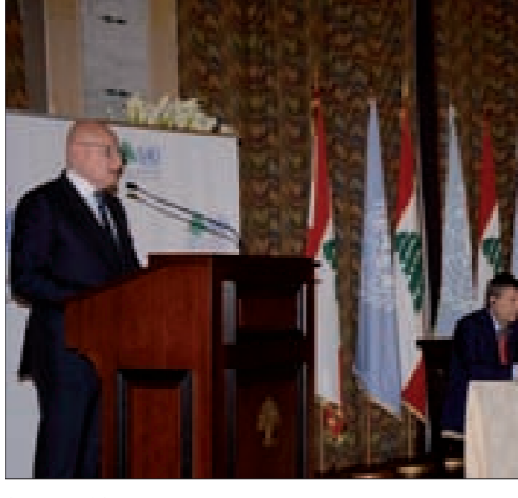
سلام متحدثاً خلال حفل إطلاق الخطة في السراي

إنّ توطين النازحين غير وارد لا في حساباتنا ولا في حسابات إخواننا السوريين». أكد رئيس الحكومة تمام سلام «أنّ توطين النازحين غير وارد لا في حساباتنا ولا في حسابات إخواننا السوريين»، لافتاً إلى أنّ الحل الجزري يكمن في وقف حمام الدم في سورية وتسوية الأزمة، الأمر الذي يفتح الباب أمام عودة جميع النازحين إلى بلدهم. وخلال رعايته حفل إطلاق خطة لبنان للاستجابة للأزمة للعام 2016 في السراي الحكومية، أكد سلام أنّ لبنان في حاجة إلى مساعدات مالية مخصصة لأهداف تنموية ولمشايع البنى التحتية، من شأنها تحفيز النمو وخلق فرص عمل، مع ما يعنيه هذا وذلك من تراجع للفقر وما يفرزه من مخاطر.