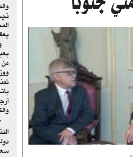
الراعي مجتمعاً إلى زاسيبكين في بكركي

في مبدأ الانتظار». وكان بطيريك الماروني التقى أيضاً رئيس الرابطة المارونية في بلجيكا ورئيس المجلس الاتحادي مارون كرم. كما استقبل قائد قوات الطوارئ الدولية العاملة في لبنان الجنرال لوتشيانو بورتولانو الذي أطلعته على الوضع العائلي في منطقة الجنوب. وأكد بورتولانو أنّ الوضع الحالي