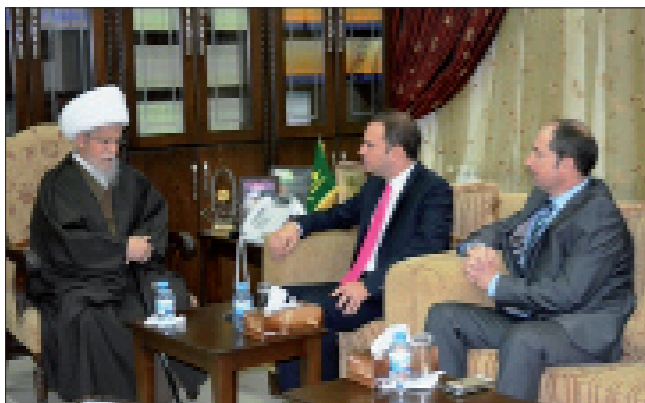
النابلسي مستقبلاً خضراً وضوءاً

بواقف الكرامة، لكن ما نراه اليوم الجمهورية أولوية أساسية، لكن لا يجوز أن يكون ترشيحه من قبل قوى خارجية، بل يجب أن يكون صنيعة إرادة اللبنانيين وحدهم لا غير».