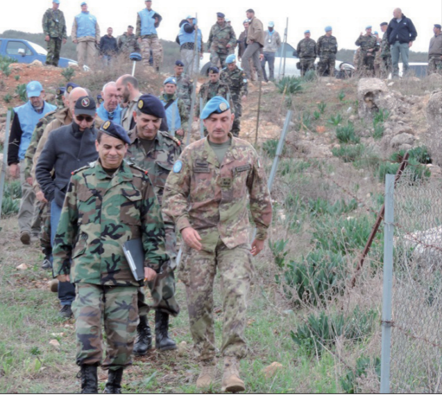
بورتولانو وضباط من الجيش و«يونيفيل»

أعلنت قيادة الجيش - مديرية التوجيه في بيان أنّ في إطار مواصلة تعليم الخط الأزرق، قامت اللجنة التقنية التابعة للجيش اللبناني، أول من أمس، بالتعاون مع فريق طوبوغرافي تابع لقوات الامم المتحدة المؤقتة في لبنان، بعملية التحق النهائي من 3 نقاط جديدة تقع في محيط بلدة كفركلا، وتثبيت المعالم عليها بصورة نهائية. وبذلك تكون اللجنة قد أنجزت منذ بدء عملها وحتى تاريخه، التحق النهائي من 228 نقطة على الخط المذكور.