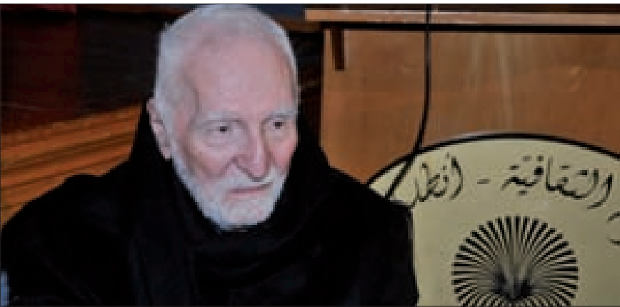
غريغوار حداد خلال تكريمه في الرابطة الثقافية انطلياس

المطران حداد كان ببناءً جسور بين اللبنانيين في أحلك الظروف وفي الأوقات العصيبة التي انقطعت فيها أواصر الصلة بين اللبنانيين، بإقامة