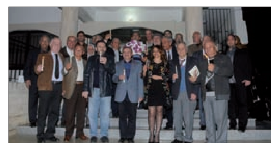
نادي الشقيف النبطية أضاء الشموع تحية إلى المطران حداد