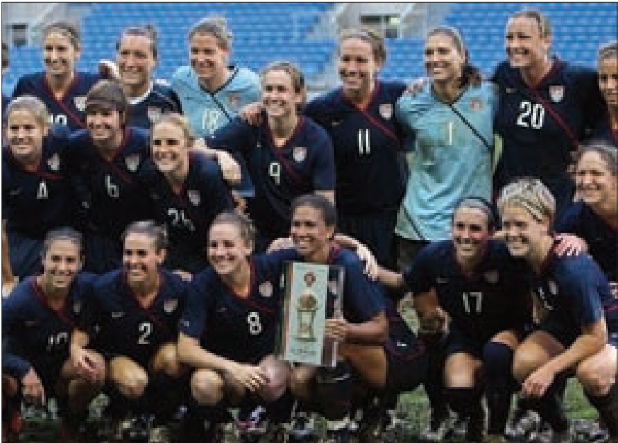
سيدات أميركا تتوجن ببطولة كأس العالم