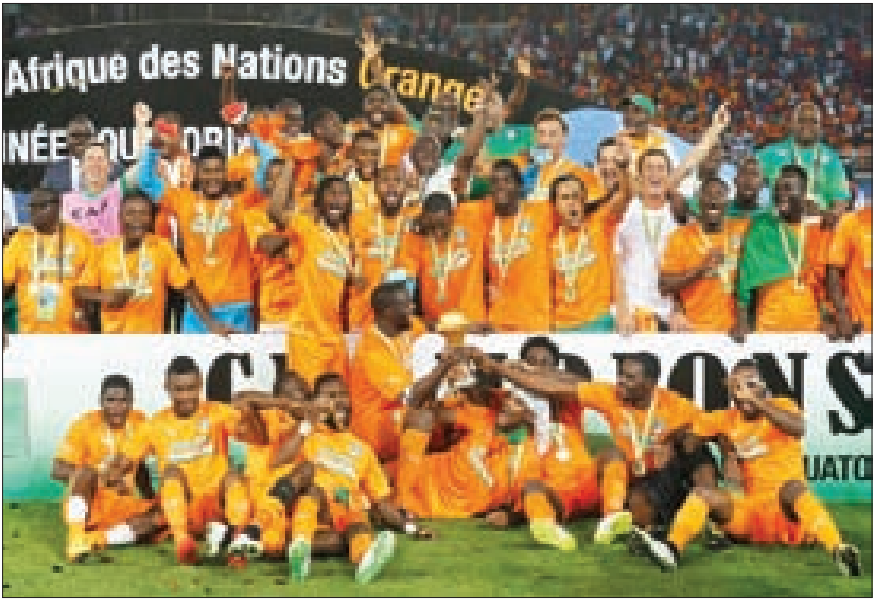
ساحل العاج تحرز كأس أمم أفريقيا في غينيا

وتوج المنتخب الفرنسي للرجال للكرة الطائرة بلقب بطل أوروبا للمرة الأولى في تاريخ البلاد، بفوزه في المباراة النهائية التي أقيمت في تشرين الأول الماضي في صوفيا البلغارية على منتخب سلوفينيا.