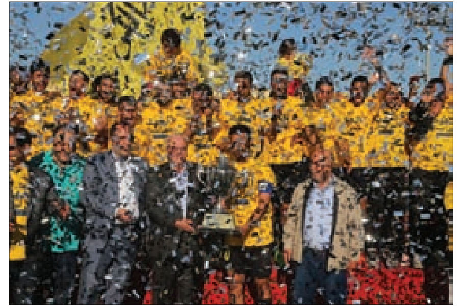
العهد يتوج بطلاً للدوري اللبناني

ورغم فشل الدون في إهداء الميرنغي أي لقب في عام 2015، إلا أنه نجح في تحقيق هذا الرقم الجديد