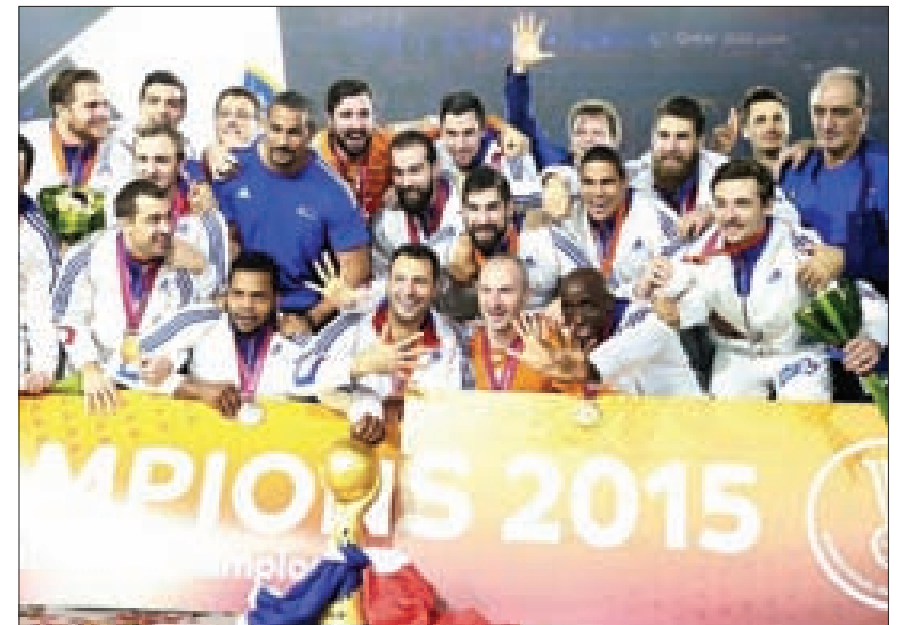
طائرة فرنسا للرجال تتوج ببطولة أوروبا للمرة الأولى في تاريخها