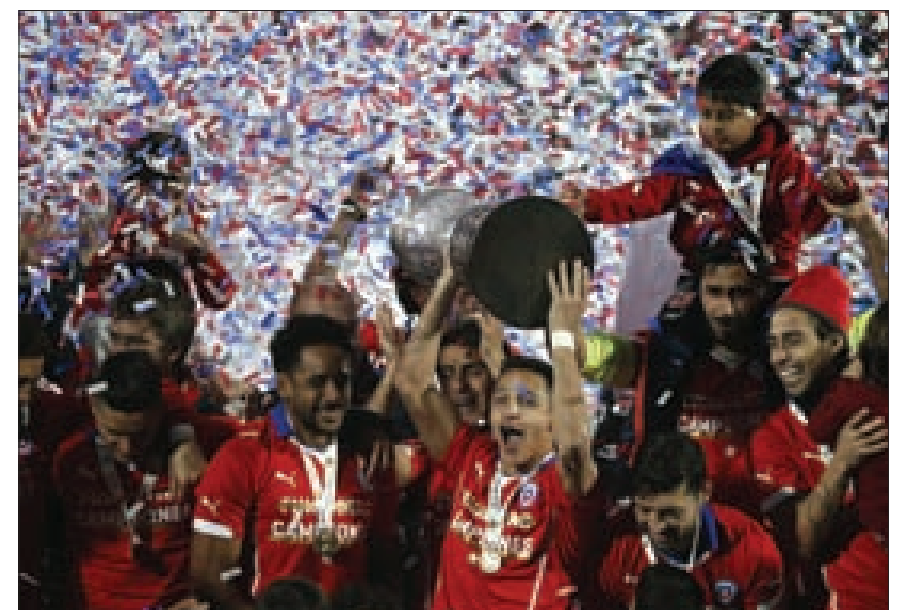
منتخب تشيلي بطلاً لبطولة كوبا أميركا للمرة الأولى في تاريخه

في عام اكتفى فيه بالاحتفاظ بجائزة الحذاء الذهبي كأفضل هداف في إسبانيا وأوروبا في انتظار نتائج جائزة الكرة الذهبية.