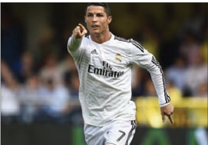
رونالدو الهدف التاريخي لريال مدريد