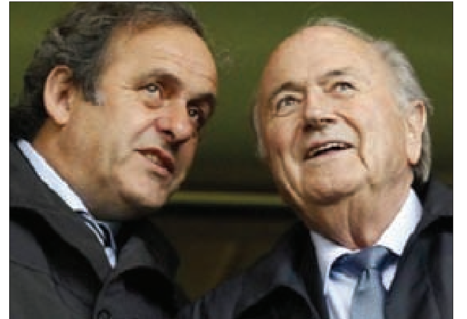
الحظر على بلاتر وبلاتيني 8 سنوات