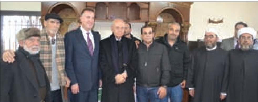
السفير لبّس مكرّماً في البقاع الغربي