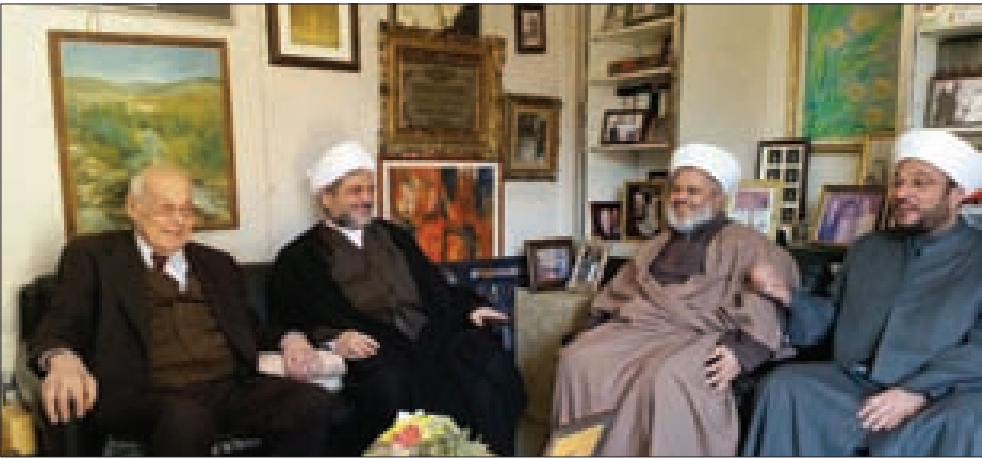
الحص مستقبلاً وفد تجمع العلماء