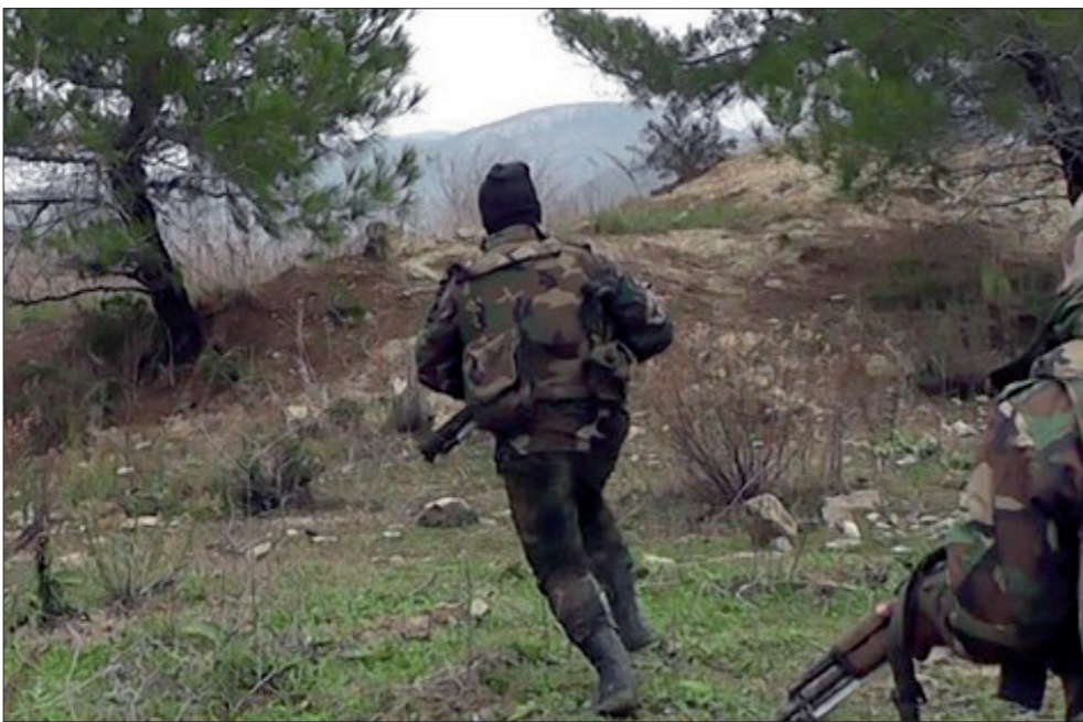
الجيش السوري يواصل التقدم على كل المحاور (النتمة ص6)

التفاهم النووي، وتقارير الوكالة الدولية للطاقة الذرية، وصولاً إلى الإعلان عن التحقق من التزام إيران بموجبها وبدء رفع العقوبات، الذي قالت مصادر أوروبية إنه سيتمّ رسمياً في الثامن والعشرين من كانون الثاني الحالي بعد اكتمال الإجراءات اللازمة لذلك، بينما ينتقل كيري إلى زورخ الأربعة ليلتقي بنظيره الروسي سيرغي لافروف في مراجعة موازية للتقارير حول سورية، ومسار التفاوض المرتقب في جنيف، وعلى جدول الأعمال قضية وفد المعارضة الذي تصرّ موسكو أن يضمّ إضافة إلى الائتلاف الذي شارك في مؤتمر الرياض، كلا من قدرتي جميل وهيتم منّا وصالح مسلم، كما تصرّ على استثناء كل من يمثل جماعات تمتّ إلى «جيش الإسلام»، و«أحرار الشام» بصفة، وتقول المعلومات الواردة من مصادر متابعه لتشكيل وفد المعارضة إن واشنطن توافق على ضمّ صالح مسلم كمثل للأكراد، لكنها لا ترى ضرورة لفرض حضور قدرتي جميل وتقرّح استبدال هيتم منّا برئيس هيئة التنسيق الوطنية حسن عبد العظيم.