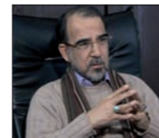
◆ محمد صادق الحسيني

حكام أنقرة وحكام الرياض ليضربوا بعضا غليظة باسمه على خلفية ما بات يُعرف بـ«معارضات معتدلة»، أو صراع جيوبوليتيكي مرة بوجه عرقي وأخرى بوجه مذهبي طائفي مقيت، والاتجاه والهدف دوماً هو إشغال المنطقة بحروب محلية متنزعة حتى لا يخسر الإمبراطور العجوز أياً من أذرعه الصهيونية في غرب آسيا الريدفة لحامية تل أبيب! ومع ذلك فقد جرّب قبل أيام، وهو في طريق إعادة التوضيح لقواته أن يختبر ولو للمرة الأخيرة في المياه الخليجية الدافئة ما يعتقد صادقاً بأنه الحارس الثوري بالمرصاد هرمز، فكان له الحرس الثوري بالمرصاد فعلاً، وكما هو متوقع ليريه (العين الحمراء) أثبتوا أنهم القادرون وحدهم على حماية مضائقه وسواحه وعواصمه دون استعانة باستعمار أجنبي. وأنه تارك بيننا دواعش بدلاء من نوع