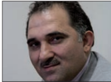
◆ معن حمية*

اللقاء «الخاطف» في قاعدة اندروز الجوية الأميركية بين الرئيس الأميركي باراك أوباما والعاله الأردني الملك عبدالله الثاني (13 كانون الثاني 2016)، لم يحظ بالمتابعات والتحليلات والقرارات التي تحصل عادة بعد كل لقاء يُعقد بين قادة الدول، خصوصاً في الحالات التي يؤشر فيها اللقاء إلى خلل ما، سواء لجهة مكان انعقاده أم لجهة مواضيعه! الجانب الأميركي اكتفى بالإشارة إلى اللقاء، والقول إن برنامج أوباما «متقل»، في حين قال الديوان الملكي الأردني في بيان: «التقى جلالة الملك عبدالله الثاني، والرئيس الأميركي باراك أوباما، اليوم الأربعاء، وذلك قبيل مغادرة كلا الزعيمين مطار قاعدة اندروز الجوية في العاصمة الأميركية واشنطن، حيث تمّ التأكيد على عقد اللقاء بين الزعيمين الشهر المقبل» (النتمة ص6)