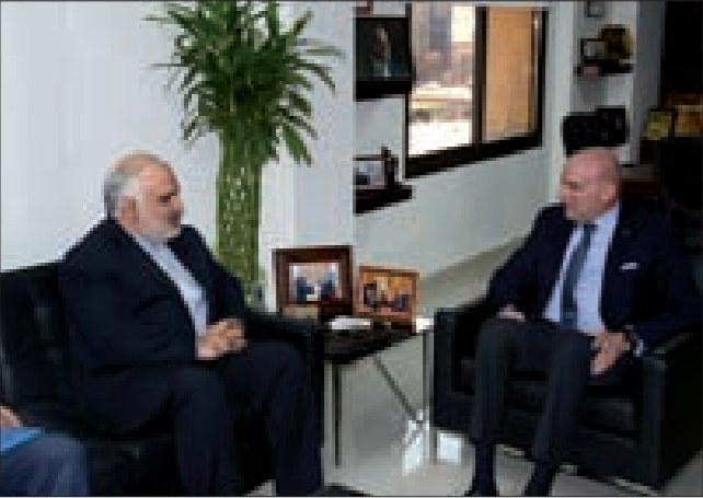
حكيم مجتمعاً إلى السفير الإيراني

هذا الموضوع وفي ظلّ انخفاض أسعار النفط أنّ تعرفه النقل يجب أن تتخطى، خصوصاً التكلفة على أصحاب النقل، في معظمها كلفة محروقات وبالتالي انخفاض سعرها أمر محتوم. لذا ومما تقدمت تنمى على معالمه القيام بما يلزم لتخفيض تعرفه النقل بما يتناسب مع خير المواطن والاقتصاد اللبناني. من ناحيتها، ستتابع وزارة الاقتصاد والتجارة المراقبة الحثيئة للالتزام بتسعيورة وزارة النقل لخدمة النقل في لبنان».