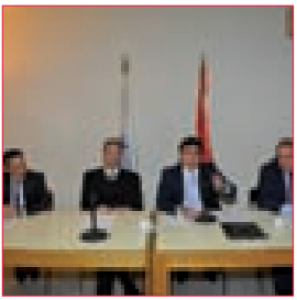
جمعية عمومية لتتجمع رجال الأعمال وإعلان أولويات 2016