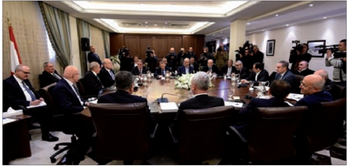
هيئة الحوار الوطني مجتمعة في عين التينة أمس

طلبت الهيئة العليا للمفاوضات في المعارضة السورية، من أعضاء الوفد المعارض الذي عيّنته للذهاب إلى جنيف، الحضور إلى العاصمة السعودية الرياض لتحضير أنفسهم للذهاب إلى جنيف قبل نهاية الشهر الحالي لحضور المفاوضات التي ترعاها الأمم المتحدة في مدينة جنيف السويسرية. مصادر في المعارضة السورية قالت في حديث لـ«البناء» إن السعودية طلبت من الهيئة العليا للمفاوضات التي عيّنها مؤتمر الرياض للمعارضة السورية، الذهاب إلى سويسرا وحضور مؤتمر «جنيف 3» حول سورية؛ وأضافت المصادر السورية المعارضة أن ولي العهد السعودي الأمير محمد بن نايف حضر إلى مقر إقامة أعضاء الهيئة العليا للمفاوضات يوم أمس وتحذرت بخطاب متوازن وهادئ. لم يشكّل أي ضغط أو تهديد، ولم يحاول أن يفرض علينا رأياً، بل أكد حقنا في اتخاذ القرار الذي نراه مناسباً، أي قرار يناسب المعارضة السورية وتدعمه المملكة، وأعرب عن قناعتنا (النتمة ص6)