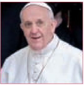
الفاطيكان يقود مساعي حثيثة للدفع باتجاه انتخاب رئيس في لبنان