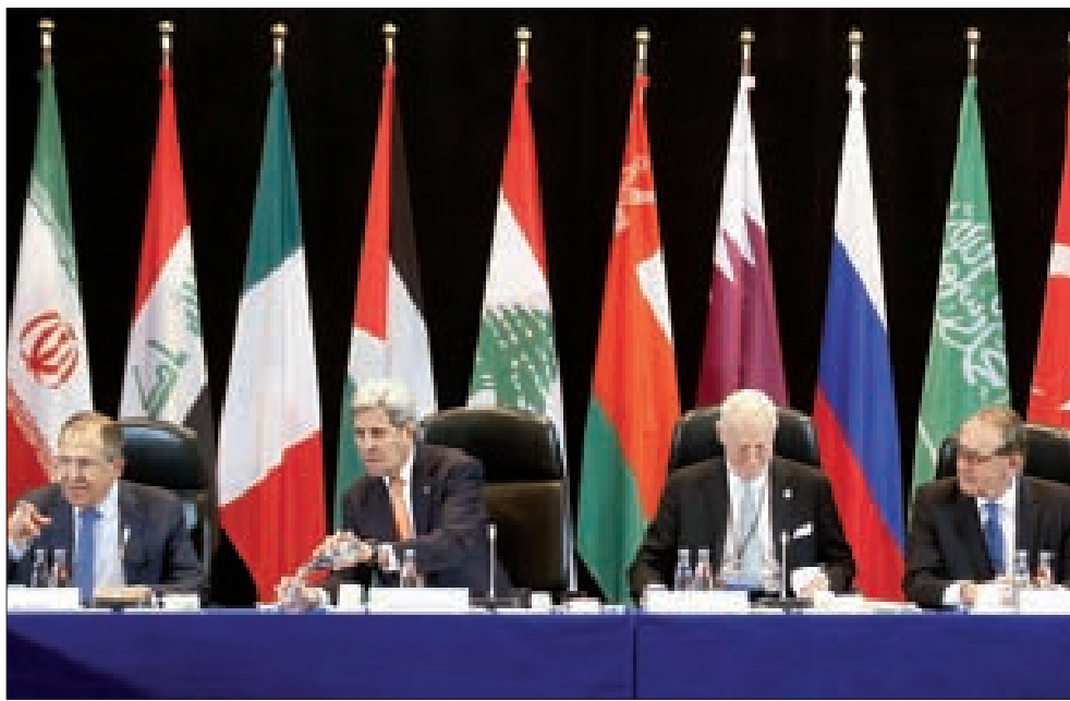
لافروف وكيري ودي ميستورا خلال مؤتمر ميونيخ

ولتصنيف لم ينضج إنجازها بالتراضي، ليتكفل الميدان بقول الكلمة الفصل، تحت شعار وقف النار والمطالبات المتعاكسة، من جهة بالتقيد بوقف النار ومن جهة مقابلة بتصنيف الإرهاب ليتمّ استثناء تنظيماته من أحكامه، ومثل وقف النار العودة للحوار في جنيف، الاتجاه لتحديد موعد جديد وترك مشاورات حلحلة عقد تشكيل الوفد المعارض لدي ميستورا، بما هو رفع عتب عملياً لن ينجح شيئاً قبل أن تتغير موازين القوى، فيذهب المتفاوضون إلى جنيف ولا يتفاوضون، بل يتبارى جيوشهم في الميدان. خلال شهر حتى منتصف آذار تبدو سورية ساحة اشتباك كبير يحتاج وقائع صارخة حتى تنضج ساعة السياسة، وربما تكون اللحظة مناسبة مع موعد زيارة الملك السعودي سلمان بن عبد العزيز إلى موسكو في منتصف آذار المقبل، في سياق بين خيارات عرضها للافروف. عملية سياسية عقلانية لا تبدو ناضجة، وحسم عسكري للجيش السوري يتقدم، ومخاطر عبث بتفجير كبير يتورط فيه الجميع بسبب حماقة التدخل البري السعودي أو التركي، قال أحد أبرز قادة الحرس الثوري الإيراني الجنرال حسين سلامي ما قاله رئيس وزراء روسيا ديمتري ميدفيديف وما سيقعها إليه وزير خارجية سورية، من أن الذين سيعبثون بأمن سورية ستتمّ إعادتهم إلى بلادهم بالصناديق.