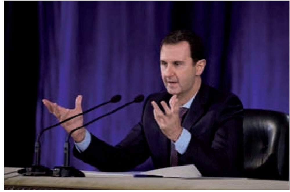
الرئيس الأسد خلال حديثه أمس أمام المحامين السوريين

أكد الرئيس السوري بشار الأسد أن تركيا والسعودية تسعيان منذ اليوم الأول للأزمة السورية للتدخل بريا، لكنهما لا تمتلكان القرار بمهاجمة سورية فهما مجرد تابعين منفذين وتقومان بدور البوق بهدف الابتزاز، لسيدهما... وإذا كانت هناك رغبة في الدخول في مثل هذه الحرب بين القوى الكبرى أم لا، وليس بين قوى هامشية لم يكن لها دور سوى تنفيذ أجندة الأسياد... وخلال لقائه مجلس نقابة المحامين المركزية والمجالس الفرعية في المحافظات، حذر الأسد من أن المخطط للمنطقة كان ولا زال تقسيمها طائفاً، لافتاً إلى أن هدف أعداء سورية كان طرح