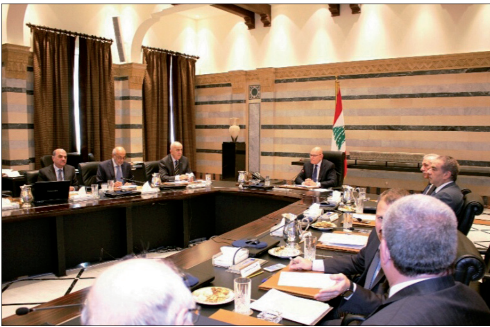
مجلس الوزراء مجتمعاً برئاسة سلام في السراي أمس

السعودية سارعت إلى التوضيح تحت سقف جديد مريح، وهو ربط التدخل البري بحدود ما يطلبه ويقرّه التحالف الدولي الذي تقوده واشنطن ضد «داعش»، وربط وزير الخارجية السعودي عادل الجبير بين توسيع نطاق الحرب على «داعش» بالنسبة للسعودية لتطال الدولة السورية، بالقول، نحن جزء من تحالف وما يقرّه ستكون جزءاً منه.