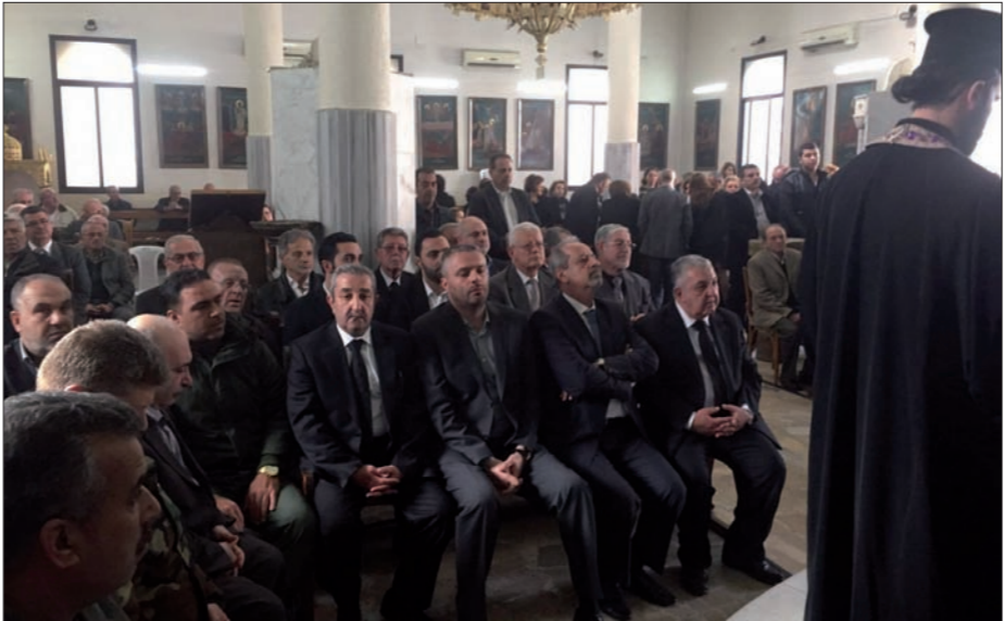
جانب من الحضور في مرمريتا