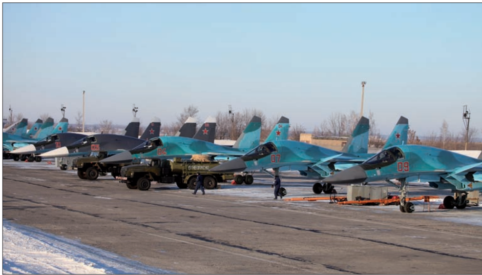
منظومة تسمح برصد التطورات في منطقة النزاع بالكامل. ومن أجل تكثيف الرقابة، يتم الاعتماد على طائرات من دون طيار ومجموعات أقمار اصطناعية السوري تنفذ بواسطة الرادارات التابعة للمنظومات

ومنذ بدء تنفيذ الاتفاق يوم السبت الماضي تبادلت الحكومة السورية والمعارضة الاتهامات بانتهاكه لكن مراقبين دوليين يقولون إن أعمال العنف تراجعت. وقال دي ميستورا إنه إذا لم يحدث تقدم بشأن وقف الاقتتال وبشأن وصول المساعدات الإنسانية فقد تُؤجل الجولة التالية من محادثات السلام «قليلاً». وتقرر مبدئياً استئناف المحادثات يوم الاثنين السابع من آذار.