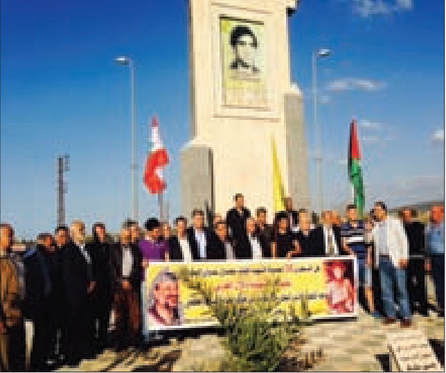
من الوقفة التضامنية

لمناسبة الذكرى السنوية 38 لاعتقال عميد الأسرى في السجون «الإسرائيلية» يحيى سكاك، أقيمت وقفة تضامنية مع قضيته أمام النصب التذكري للأسير سكاك، والتي تحوّلت إلى مهرجان شعبي عند مدخل المنية، رفعت خلاله صور الأسير سكاك والإعلام الفلسطينية بمشاركة من فلسطين ولبنان، مؤكداً أنّ قضية الأسير سكاك «ستبقى حيّة حتى عودته إلى وطنه وأتمتة التي رفع رأسها إثر مشاركته في العملية البوليفية داخل فلسطين المحتلة هو ورفاقه الشهداء دلال المغربي وابن المنية عامر عامرية، كمال عدوان، والذي كان من أوائل المدافعين عن فلسطين هو ورفاقه 133 فدائياً (مجموعة دير ياسين) يكفون مسيرة يحيى.