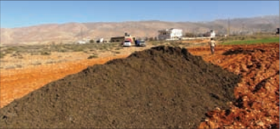
نفايات المستشفيات مطمورة في بعلبك

بأنظار ما سيصدر عن الحكومة اليوم بشأن أزمة النفايات، برزت قضية طمر النفايات الطبية «خلسة» في منطقة بعلبك، ما ينذر بأخطار صحية على الأهالي فضلاً عن تسميم الأرض. فقد اكتشف أهالي بلدتي يونين والصوانية المتجاورتين شمالي بعلبك، إلقاء أكوام من النفايات المطبوعة في المنطقة السهلة تشبه الأسمدة الكيميائية، إلا أنّ روائحها الكريهة جعلت الأهالي يرتابون من ماهيتها، وبعد التدقيق في موادها تبين أنها نفايات مستشفيات مطحونة. وأكد شهود عيان من بلدة يونين، أنّ «شاحنات مجهولة ألقت الحمولة فجر قبل يومين»، وطالبوا «المعنيين بالكشف عن الفاعلين واتخاذ الإجراءات بحقهم، فلا يجوز تحويل الأراضي الزراعية إلى مكبات لمواد سامة وخطرة». وفور تلقي الخبر، عمّد محافظ بعلبك الهرمل بشير خضر، على «الأجهزة الأمنية إجراء التحريات اللازمة، ومنع تفريق أي نفايات بشكل عشوائي، وتوقيف السائقين المخالفين مع شاحناتهم».