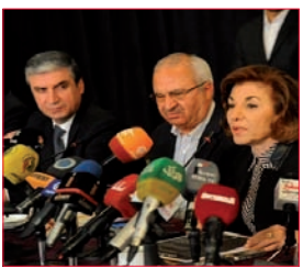
في يوم الأرض... انتصار سورية يصنع مستقبل الأمة والعالم