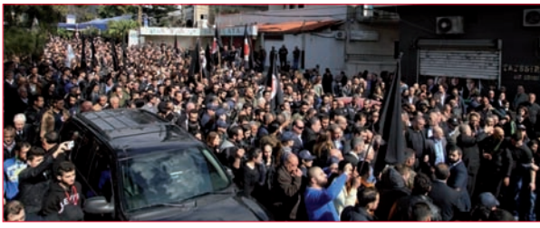
«فورين بوليسي»: «القومي» يكتسب شعبية متزايدة على أرض الواقع... 5