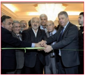
الاحتفالات بذكرى يوم الأرض تؤكد التمسك بالمقاومة