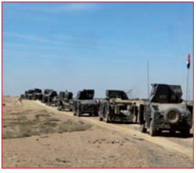
العراق: استكمال تطهير كبيسة... ومقتل «عصابة» الصواريخ السامة