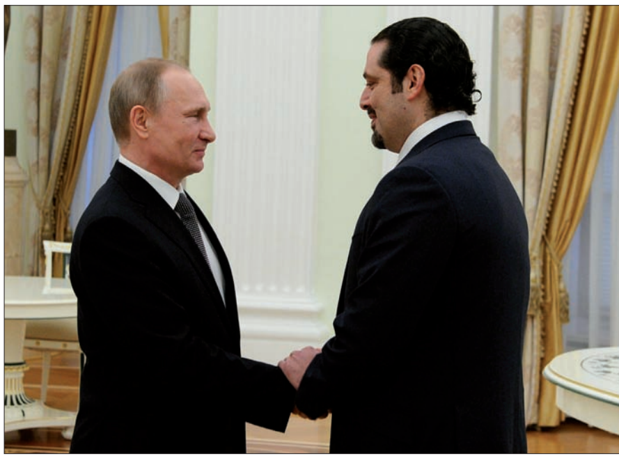
بوتين مستقبلاً الحريري في الكرملين (الداخلي ونهرا)

ويفتح الأفاق لحل سياسي يقوم على ما قدمه الرئيس الأسد من مبادرة للدعوة إلى انتخابات رئاسية مبكرة، يمكن للسعودية اعتبارها قبولاً للتخني وإعادة الترشح، وهذا حل لا يمكن رفضه أو الوقوف بوجهه لأن البقاء خارجة سيعني البقاء خارج قطار الجول، فكان الجواب السعودي باعتبار روسيا وسيطاً نزيهاً في الحل السياسي وتثبيت الهدنة، وهو ما أسس لترتيب لقاء الحريري بالرئيس الروسي، رغم عدم وجود موعد مسبق، لترجمة إعلان الحريري بالأصالة عن نفسه وبالوكالة عن السعودية بتأييد المساعي الروسية للحل السياسي في سورية، بعدما كان خطاب الحريري كما الخطاب السعودي، يتعاملان مع الدور الروسي في سورية بصفته عدواناً واحتلالاً. فعرض الرئيس بوتين، وفقاً لمصادر إعلامية روسية، أن يترجم التعاون السعودي الروسي في لبنان حيث الحرب على الإرهاب ترتبط عضوياً بالحرب في سورية، وحيث يستحيل الحصول على دعم جوي غربي في أجواء متداخلة مع سورية، وروسيا مستعدة لتقديم هذا الدعم إذا حصلت على طلب رسمي من الحكومة اللبنانية، التي يملك الرئيس الحريري والسعودية حق الفيتو على اتخاذها قراراً كهذا، سبق أن عطلوا مثله من التنسيق العسكري السوري اللبناني مراراً، وكانت الحصيلة إعلان الحريري أهمية التعاون العسكري الروسي اللبناني في الحرب على الإرهاب.