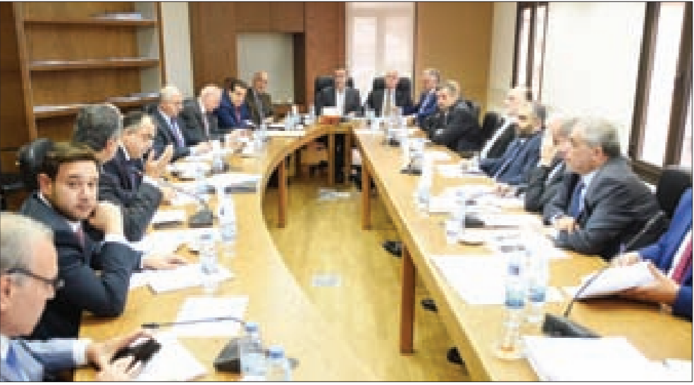
جانب من اجتماع لجنة الإعلام

ذلك، في الشرق أو الغرب». وناشدوا المسؤولين «العمل الجدي على درء موجات التطرف والإرهاب، وعلى دعم الجيش الوطني في لبنان والبلدان المعنيتة، للتصدي لها ومعالجتها بكل الوسائل المتاحة»، منددين بشدة «بجريمة اقتلاع المسيحيين وغيرهم من المكونات المستضعفة من أرضهم في العراق وسورية، وبما سبق ولحق ذلك من قتل وتهجير وتشريد لآلاف الأبرياء، مما يرقى إلى درجة «الإبادة» للشعوب والحضارات العريقة في الشرق الأوسط، على غرار ما حصل منذ مئة عام في الإمبراطورية العثمانية». ودعا المجتمع الدولي إلى العمل جدياً على حل القضية الفلسطينية، وعلى إيجاد حل سلمي للحروب الدائرة في المنطقة، ولا سيما في سورية والعراق، والتي تسببت بنزوح أكثر من مليون ونصف مليون سوري إلى لبنان، بالإضافة إلى النازحين العراقيين، واللاجئين الفلسطينيين الموجودين فيه منذ سنة 1948. وهذا ما يزيد الأزمة اللبنانية خطورة. وشدوا على «أنّ الحل السياسي للصراعات القائمة في المنطقة هو الوحيد المتوخى، كي يعود جميع النازحين إلى ديارهم. ويانتظر ذلك يحتاج لبنان إلى الدعم القوي من قبل الدول والمنظمات الدولية، كي يتمكن من مواجهة هذه المعضلة المصرية». وأكدوا بذل الجهد «من أجل المحافظة على العيش معاً، مسيحيين ومسلمين، بالاحترام المتبادل لحقوق جميع المواطنين وواجباتهم». وإذ شكر المجتمعون للطيريك الراعي ضيفاته، عبّروا له عن تهنيتهم ببلوغه الذكرى الخامسة لاعتلائه الكرسي البطريكي.