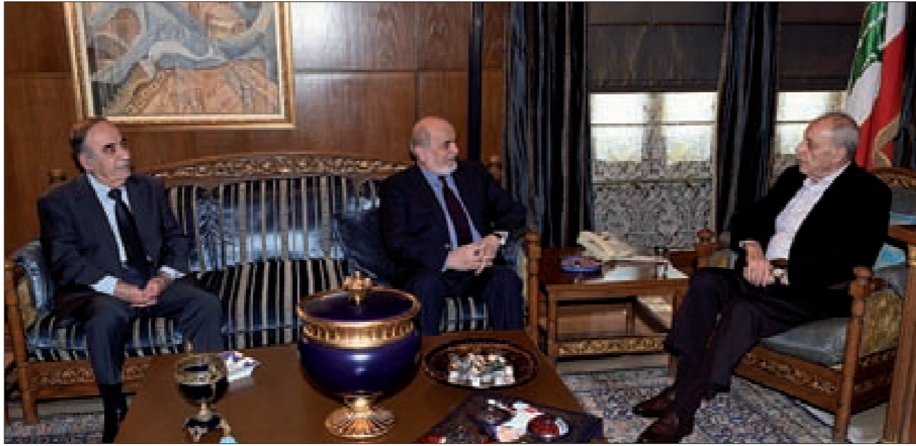
بري مستقبلاً حرّدان وقاصو في عين التينة أمس (التمتعة ص6)

كتب المحرر السياسي بينما تتقدّم في الكويت الاستعدادات لاستضافة جولة الحوار اليمني المقبلة على إيقاع التحضيرات التي تجريها البعثة الأممية لترتيبات الهدنة، أسقطت واشنطن في مجلس الأمن مشروع قرار روسي يفرض مشاركة الأكراد في محادثات جنيف السورية، دون أن يسقط التفاوض الروسي الأميركي على المقايضة المناسبة مع الأكراد بين التراجع عن إعلان الفدرالية ونيل المقعد التفاوضي في جنيف، أسقط الجيش السوري لعبة جبهة النصر في أرياف حلب بفتح حرب استنزاف، تحاول امتصاص نتائج انتصارات الجيش في تدمر، وتشكل حاجز حماية لمعقلها في إدلب، فبدأ خطة تحرير ما تبقى من الأرياف الحلبية وصولاً لحسم متوقع للأحياء التي لا تزال تخضع لسيطرة الجماعات المسلحة، مفتتحاً واحدة من أهم المعارك في الحرب على سورية لما تمثّل حلب من مكانة وأهمية على الصعيد الشعبي والسكاني والجغرافية والاستراتيجية، ونجحت سورية بإسقاط مناورة