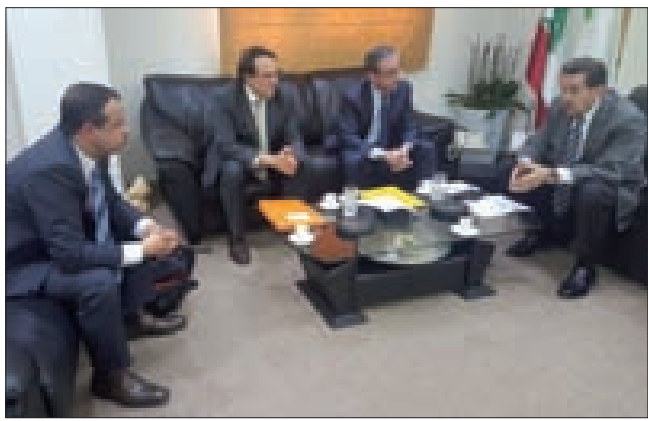
حرب مجتمعاً إلى أصحاب الشركات المرخصة

في شأن قطاع الإنترنت وتحديداً شركة Sodetel التي تتقاسم حصتها مناصفة مع «أورانج» والدولة اللبنانية.