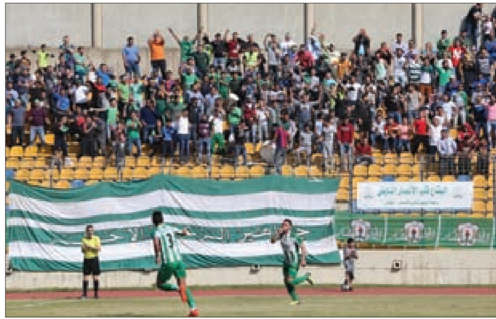
جماهير الانصار متعطشة لفوز فريقها

بمسائل خارج الملعب، ففي لحظة ضياع أو تراخ قد تتقلب الأمور رأساً على عقب. التحكيم، وهنا لا بد من الإشادة بالأداء التحكيمي المحلي الذي شهدته المباريات الأربع السابقة، فعلى طاقم التحكيم أن يواصل في حياديته وتركيزه لإخراج المباراة بنتيجة عادلة، يتقبلها الخاسر قبل الرابع. - البديل المناسب في مقاعد الاحتياط، فغنى الصف الاحتياطي بلاعبين مائلين بأبائهم لزملائهم المشاركين في المباراة، والتركيز مطلوب أيضاً من الاحتياطيين. - الروح القتالية، فالتوفيق إلى تحقيق الفوز يُعتبر بمثابة نصف الطريق إلى تحقيقه، وهذا يلزمه بذل الجهود المضاعفة. - الحظ، وهنا لا يستطيع أحد أن يتدخل، على أمل متابعة نهائي من العيار المثير، ومبروك سلفاً للفائز.