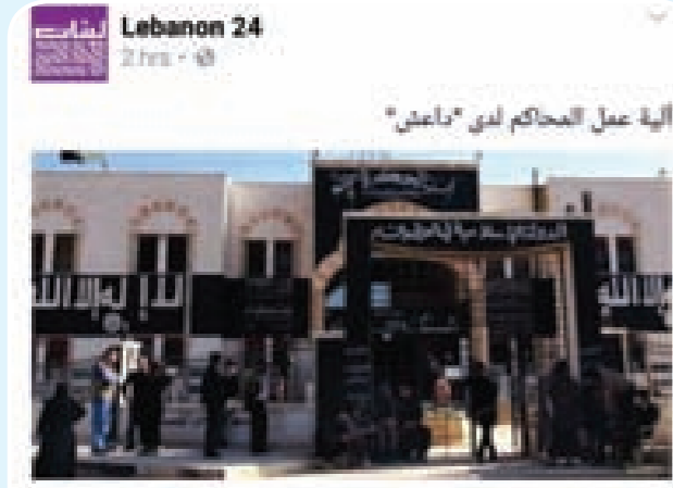
هذه هي خريطة سجون «داعش» ومحاكماته... لجان تنظيم «داعش» إلى ما يسمى «مراكز الاحتجاز السرية».

لجان تنظيم «داعش» إلى ما يسمى «مراكز الاحتجاز السرية» يعد بدء هجمات التحالف الدولي على مواقعها في سورية في 23 أيلول 2014، وسجلت الشبكة السورية لحقوق الإنسان قيام تنظيم «داعش» باعتقال ما لا يقل عن 6318 شخصاً، بينهم 713 طفلاً، و647 سيدة، وذلك منذ الإعلان عن تأسيسه في 9 نيسان 2013 حتى آذار 2016.