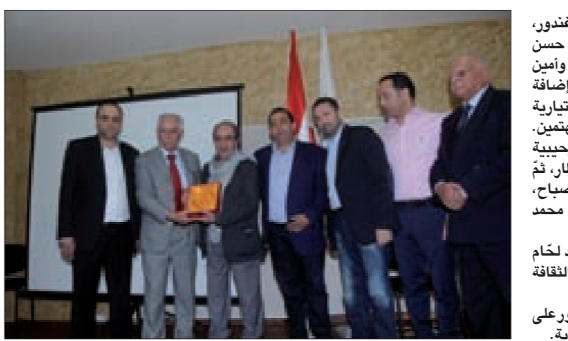
محمد بيطار، رئيس بلدية النبطية الفوقا راشد غنّور، وإمام البلدة الشيخ عباس غنّور، مدير ثانوية حسن كامل الصباح الأستاذ عباس شميماني، وأمين الشؤون الثقافية في النادي الدكتور علي وهبي، إضافة إلى عدد من الوجوه السياسية والبلدية والاختيارية والاجتماعية والتربوية والثقافية، ومهتمين بعد التشيد الوطني اللبناني، كانت كلمة ترحيبية ألقاها رئيس النادي الأهلي الرياضي محمد بيطار، ثمّ كلمة لنادي الشيف القاها المخرج حسام الصباح، وقصيدة ترحيبية من وحي المناسبة القاها محمد حسين معلم.

بعد ذلك، ألقى المحتفي به الفنان دريد لحام كلمة وجدانية مؤثرة، مشيداً بالمقاومة، لأنها الثقافة والتاريخ.