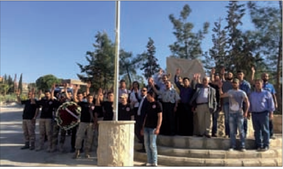
عند النصب التذكاري