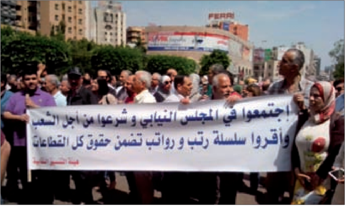
اعتصام في طرابلس

وأكد «أن خطوات التصعيد عندها من دون سقف، ومن يراهن على عكس ذلك نقول له إنه مخطئ»، داعياً «جميع المعلمين والأساتذة في القطاع العام والخاص والموظفين والمتقاعدين والمتعاقدين